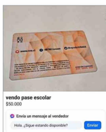
La TNE es comercializada a través de internet, al igual que sus sellos.