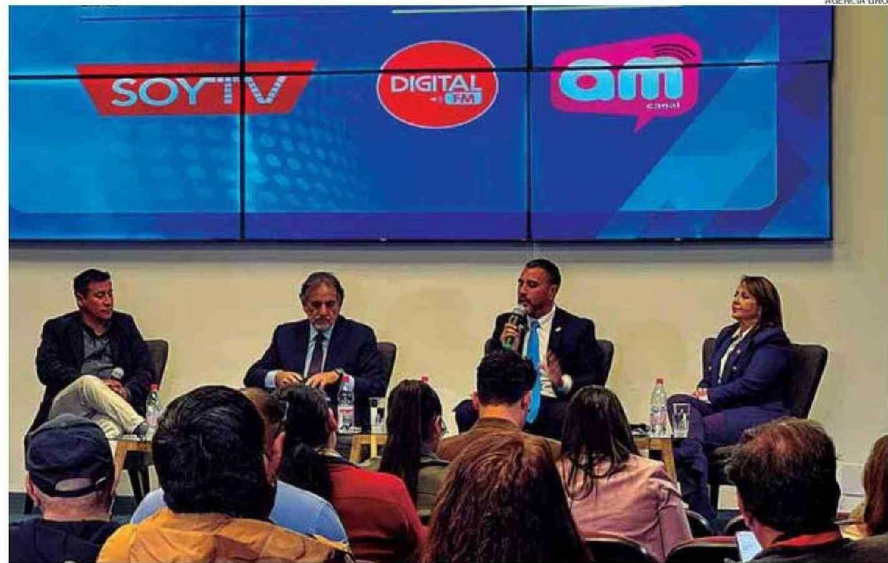
EL DEBATE SE REALIZÓ AYER EN EL AUDITORIO DE EL MERCURIO DE ANTOFAGASTA Y FUE TRANSMITIDO POR SOYANTOFAGASTA Y OTROS MEDIOS.

Sobre esto último, se destacó la necesidad de un trabajo más coordinado con la industria portuaria de la región, para lograr impulsar nuevas industrias.