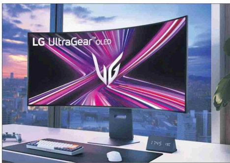
Así luce el LG UltraGear Oled Flexible en su máximo nivel de curvatura.

basadas en las preferencias del usuario o el momento del día, añadiendo un toque estético que transforma la pantalla en una pieza decorativa.