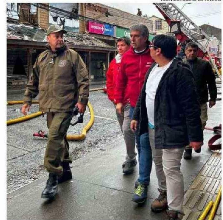
AUTORIDADES RECORRIENDO LA ZONA DEL SINIESTRO.

talló que "el Gobierno Regional ya ha definido un plan que se presentará el próximo lunes en el Consejo de Gabinete, en el que participarán también los consejeros regionales de Chiloé. Este plan contempla la implementación de medidas de ayuda directa y la coordina-