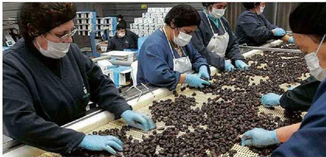
SUJETOS ROBARON 59 MILLONES EN CIRUELAS DESHIDRATADAS QUE IBAN AL EXTRANJERO.