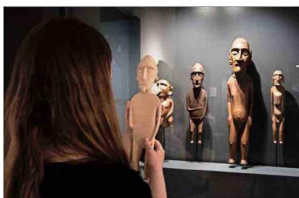
“Maestros Cultores de Rapa Nui”, en Providencia.