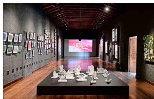
“Diálogos de Arte Contemporáneo”, en Vitacura.