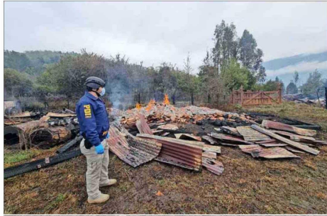
DECLARATORIA. — El destruido molino Grollmus tenía la categoría de Legado Patrimonial Arquitectónico, del Consejo de Monumentos Nacionales.