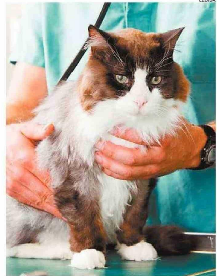
QUIENES MANEJEN MASCOTAS DEBEN ESTAR CAPACITADOS.