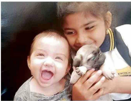
LA SONRISA INEFABLE DEL ANGELITO QUE PARTIÓ MUY PRONTO

La pequeña falleció tras contagiarse el virus sincicial y sus seres queridos creen que una atención especializada oportuna pudo haberla salvado.