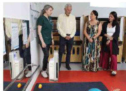
Instalación de dispositivo de purificación de aire en aula de la sala cuna Semillita del Manzanal.

83 jardines Integra de la región serán beneficiados, con la implementación de los