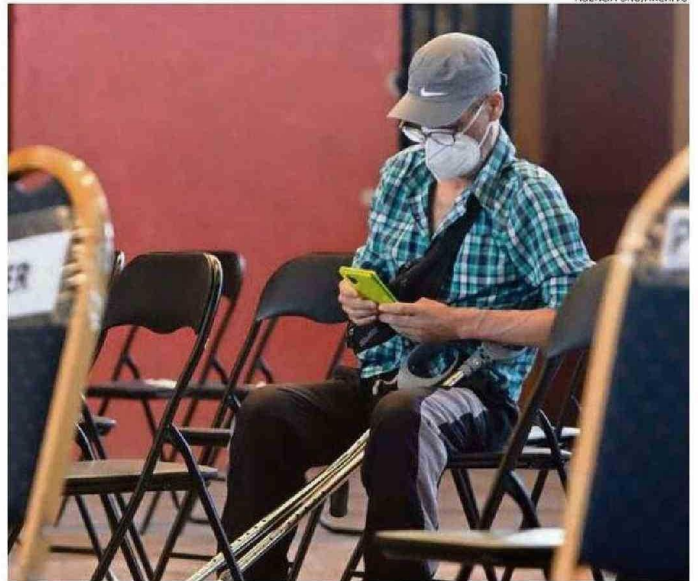
EL DISTANCIAMIENTO SOCIAL FUE UNO DE LOS MOTIVOS EN LA CAÍDA DE LA GRIPE ESTACIONAL.

Así descubrieron que el inicio del coronavirus provocó un cambio en la intensidad y la estructura de la transmisión