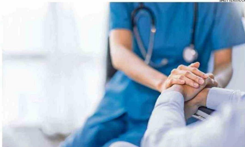
DORMIR LO SUFICIENTE DEBERÍA SER PARTE DEL TRATAMIENTO MÉDICO DE RECUPERACIÓN.

Las conclusiones subrayan la importancia de aumentar el sueño tras un infarto de miocardio y sugieren que dormir lo suficiente debería ser uno de los puntos centrales del tratamiento clínico y los cuidados tras un infarto, incluso en las unidades de cuidados intensivos.