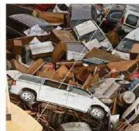
EL CAMBIO CLIMÁTICO NO SOLO CAUSA...

Los pacientes se dividieron en dos grupos -buenos y malos durmientes- en función de la calidad de su sueño durante las cuatro semanas si-