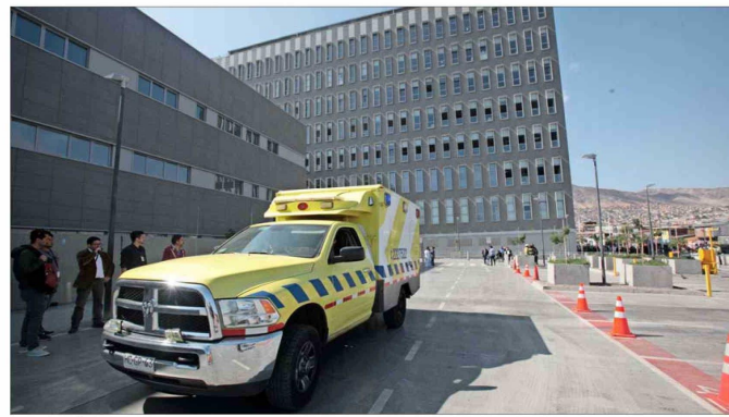
AUDITORÍA. — La investigación de la Contraloría se está llevando a cabo en otros nueve recintos del país para evaluar la calidad de los registros del sistema público de salud. En la imagen, el hospital de Antofagasta.

Sobre el impacto de este hallazgo, advierte que “hace más