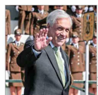
De concretarse la iniciativa, sería el exmandatario que obtendría más rápido el reconocimiento.

Museo Violeta Parra Cuestionan uso de recursos de la entidad: recibe $47 millones al mes y tiene 16 funcionarios, pese a estar inutilizable hace más de cinco años. | C 5