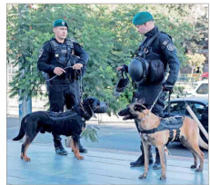
En medio de un riguroso operativo de seguridad se efectúa la formalización de cargos de cinco integrantes de la organización criminal, en el Centro de Justicia.

Banda de "Los Piratas" Desde secuestros planeados por WhatsApp hasta asesinatos por desobediencia: las brutales prácticas de la organización detrás del crimen de Ojeda