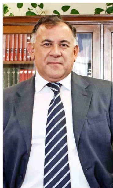
Eric Aedo (DC), vicepresidente de la Cámara.

puede ser esa la consecuencia de una acusación constitucional, que se dejen de lado los temas que son importantes para la ciudadanía. No me cabe duda de que los parlamentarios comparten ese criterio, nadie va a defender que cualquier acusación pueda ser a costa de otras tareas que son importantes".