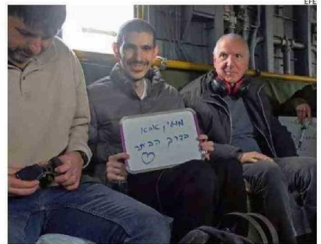
UNO DE LOS TRES REHENES ISRAELÍES LIBERADOS AYER.