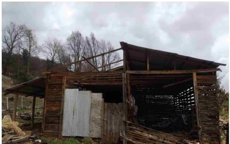
CONDICIONES ACTUALES del Sector Cerro El Padre, Quilaco.

Así mismo, el vecino compartió videos y fotografías donde se aprecian hectáreas de bosque nativo botados en los caminos, sin posibilidad de gestionar colaboración para realizar labores de despeje. "La mano de obra es esencial en este momento. Se requiere apoyo para limpiar