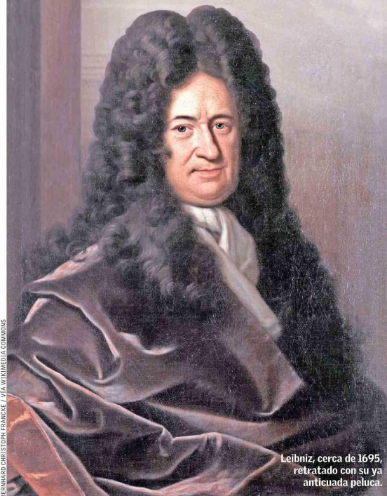
Leibniz, cerca de 1695, retratado con su ya anticuada peluca.

En años recientes se han sumado a este esfuerzo autores como Andrea Wulf, con