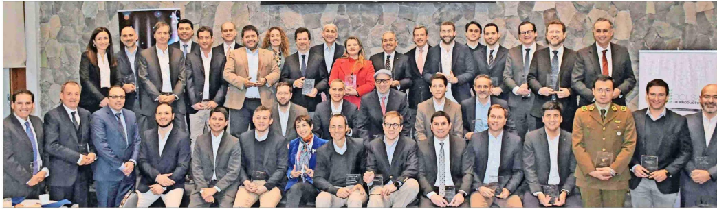
De más de 20 diversos sectores son las organizaciones premiadas.