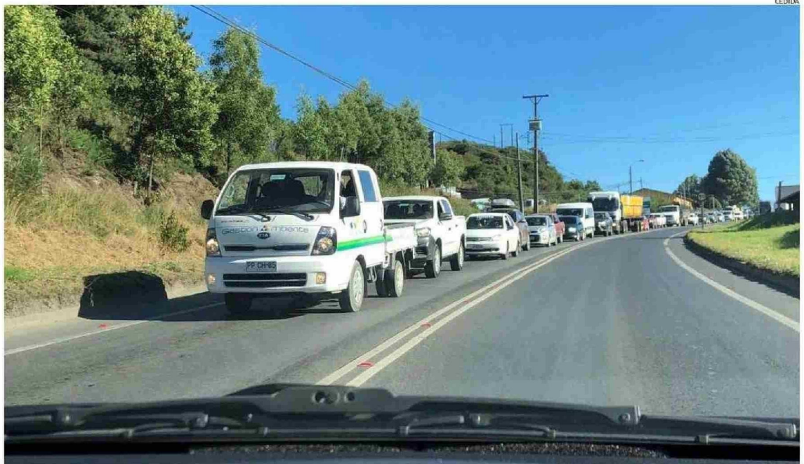
LA DOBLE VÍA CHILOTA AYUDARÁ A DESCONGESTIONAR LA RUTA 5, QUE EXPERIMENTA FRECUENTES ATOCHAMIENTOS, ESPECIALMENTE EN LA TEMPORADA DE VERANO.

El tramo Chacao-Chonchi fue ratificado por el Presidente Gabriel Boric durante su gira de tres días en enero de 2024, reafirmando la importancia de la continuidad de la Ruta 5 de alto estándar para conectar al país desde Arica hasta la ciudad queilonina el año 2033. Se pretende invertir al menos unos 655 millones de dólares