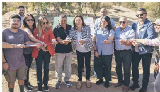
Inauguración proyecto en el Cerro Santa Luisa, María Pinto, que integra innovación y técnicas ancestrales para optimizar la gestión hídrica en tres comunidades rurales de la Región Metropolitana.

Ubicado en el Parque Arenas en la Región Metropolitana, Nilus utiliza técnicas ancestrales para almacenar y proteger el agua en los ecosistemas precordilleranos a través de estructuras verticales llamadas "estupas de hielo".