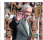
De concretarse la iniciativa, sería el exmandatario que obtendría más rápido el reconocimiento.

Cuestionan uso de recursos de la entidad: recibe $47 millones al mes y tiene 16 funcionarios, pese a estar inutilizable hace más de cinco años. | C 5