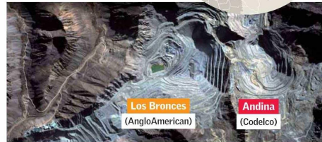
Producción de Andina y Los Bronces En miles de toneladas de cobre fino.