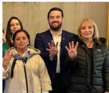
Página 6, 7 y 8