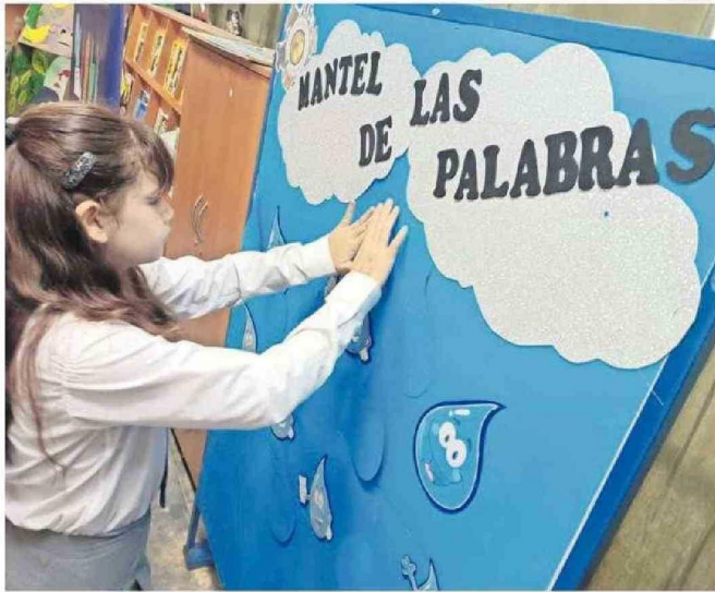
ESTA HERRAMIENTA YA SE ENCUENTRA DESDE JUNIO EN TODAS LAS ESCUELAS PÚBLICAS LA REGIÓN.