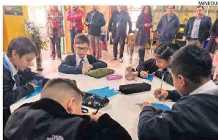
SE APLICA A ESCOLARES DE PRIMERO A CUARTO BÁSICO.

¿Qué es el Mantel de Palabras? En un juego educativo para todas las familias, creado por el Ministerio de Educación, que comprende de una especie de tablero cuya idea es que estudiantes de 2do a 4to Básico, y sobre todo las familias puedan participar para desarrollar las habilidades del lenguaje en instancias cotidianas, intercambiando historias reales y ficticias, cultivar la imaginación, despertar el apetito de conocer palabras.