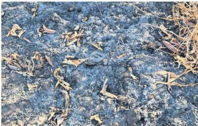
PREDIOS QUEDAN DEVASTADOS.

Los cultivadores expresaron su desazón por la falta de claridad de los protocolos del organismo fiscalizador al mismo tiempo que afirmaron que está dañando la agricultura campesina mediante un verdadero exterminio. "Exigimos que se trabaje de manera conjunta con el