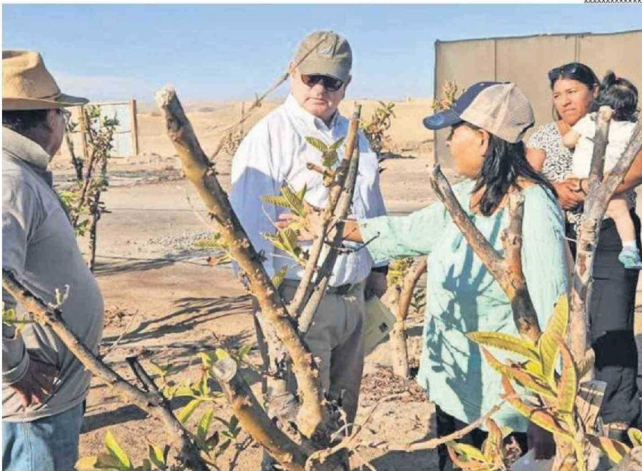
AGRICULTORES MANIFESTARON SU DESAZÓN E INCERTIDUMBRE. DICEN QUE SE HA ARRASADO CON TODO.