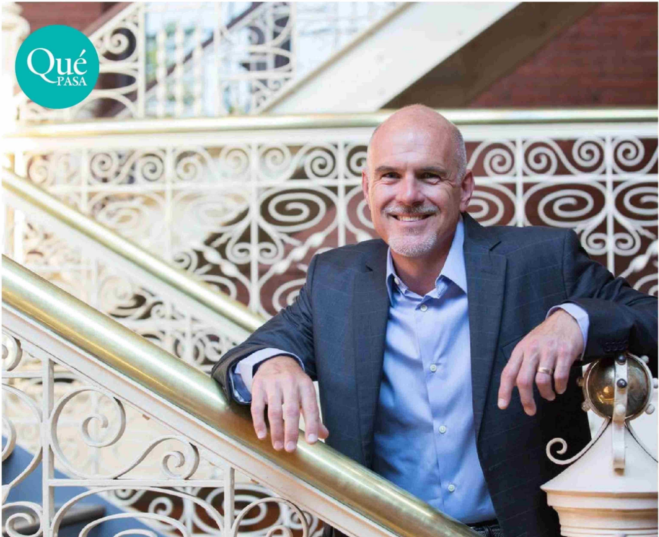
► El neurocientífico estadounidense Michael Platt se dedica a investigar los procesos de toma de decisiones del cerebro.