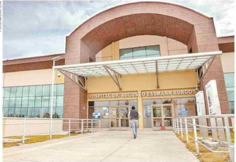
Del total de especialistas que cuenta el Hospital Augusto Essmann, 22 tienen su certificación de especialidad Conacem, representando un 65%.

» Del total de 34 médicos, se indicó que 1 es boliviano, 15 chilenos, 1 colombiano, 1 guatemalteco y 16 venezolanos