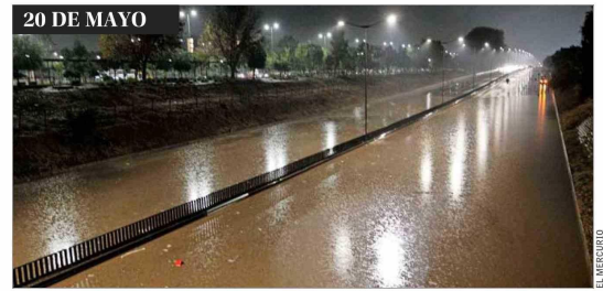
20 DE MAYO Hace menos de un mes, el mismo tramo se vio anegado, impidiendo la circulación de vehículos cuando habían caído 30 mm de lluvia.