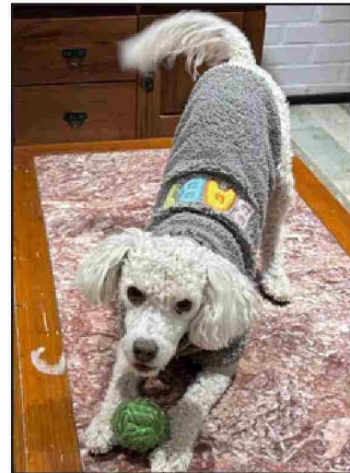
Thor, perro que se extravió el pasado 17 de mayo en la calle Reyes de la comuna de San Esteban.