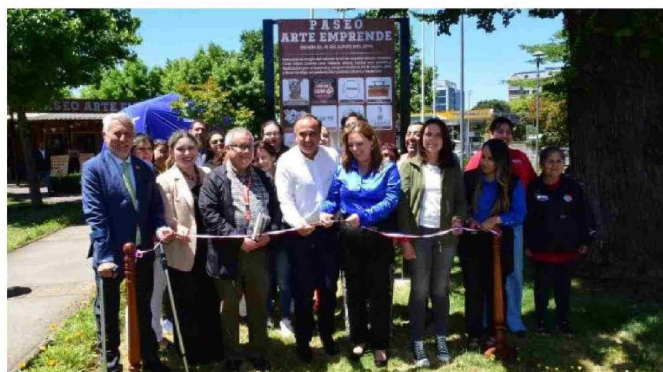
LOS LOCATARIOS Y AUTORIDADES celebraron los ocho años de la creación del Paseo Arte Emprende.

- Propuesta de seguridad: Instalación de cierre perimetral.