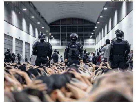
BUKELE DIJO QUE A ADMITIRÍAN A PRESOS CRIMINALES DE EE.UU.