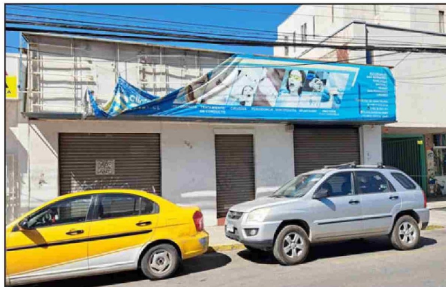
Así luce actualmente la Clínica Dental Samy. Los números de contacto en el cartel no corresponden a la empresa; el celular no responde y el teléfono fijo es de un centro de radiografías.