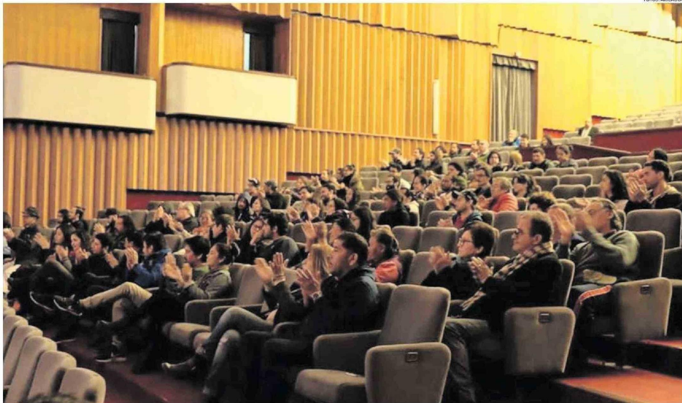
EL CERTAMEN ESPERA REUNIR EN SU PROGRAMACIÓN UNA SELECCIÓN DE PELÍCULAS NACIONALES E INTERNACIONALES DESTACADAS DEL ÚLTIMO AÑO.