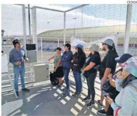
LA ESTACIÓN MUNICIPAL YA ESTÁ EN PROCESO DE CAPTACIÓN DE DATOS.

Cuatro estaciones de monitoreo a la calidad de aire están activas en Calama, equipos que captan datos.