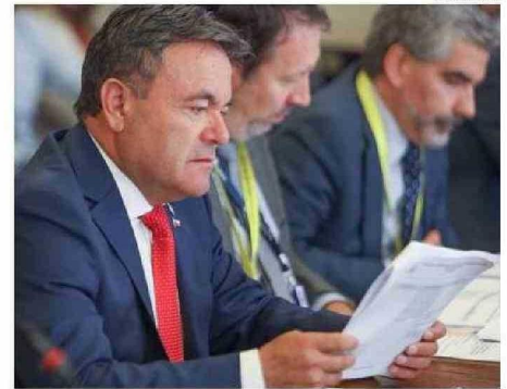
BELTRÁN DETALLÓ QUE LAS VÍAS POR LAS QUE TRANSITA EL TREN ESTÁN PRÁCTICAMENTE INUNDADAS DE MALEZA LO QUE SUMADO A LA TEMPORADA ESTIVAL, PODRÍA GENERAR INCENDIOS.