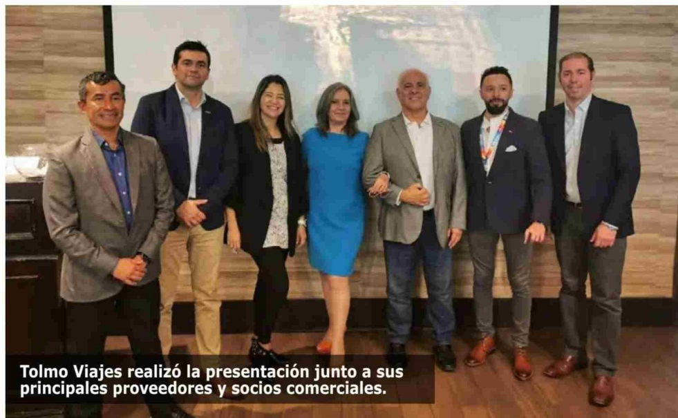
Tolmo Viajes realizó la presentación junto a sus principales proveedores y socios comerciales.