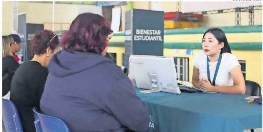
EN EL ÁREA NORTE DEL CAMPUS CENTRAL DE LA UNIVERSIDAD DE ATACAMA SE DESARROLLA UNA ATENCIÓN DE APOYO PRESENCIAL PARA EL PROCESO DE MATRÍCULAS, QUE ES ONLINE

"Destacan las carreras que tienen mayor demanda, que se mantienen las mismas del año 2024: medicina, que tiene una lista de espera sobre 900 estudiantes, Psicología, Obstetricia y Puericultura, Derecho y En-