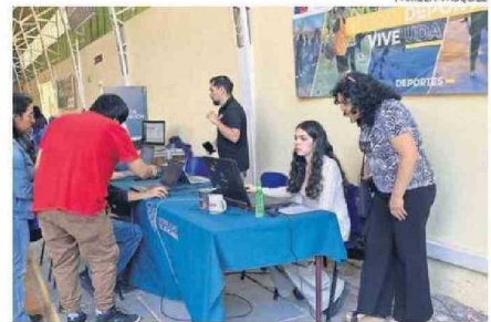
ESTUDIANTES ACOMPAÑADOS DE SUS FAMILIAS LLEGARON A LA UDA.

"Yo hago una evaluación positiva, porque estamos viendo la demanda de la comunidad, el interés en participar de nuestro proceso como Universidad. Hemos posicionado