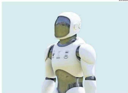
ASÍ LUCIRÁ EL ROBOT UNA VEZ TERMINADO. SE MOVERÁ CON RUEDAS.