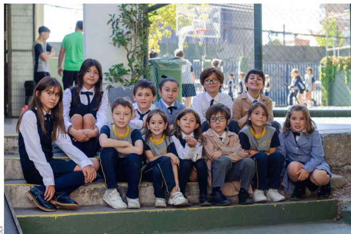
En el área académica, han incorporado innovaciones tanto en educación básica como media, utilizando metodologías complementarias de apoyo, tales como la diferenciación y el aprendizaje basado en proyectos.

como la diferenciación y el aprendizaje basado en proyectos (ABP). Esta última tiene como finalidad apoyar en la