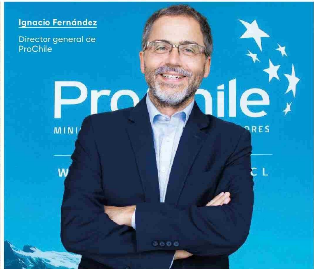
Ignacio Fernández Director general de ProChile

Chile Oliva, que lleva el registro en toneladas y no en valores como ProChile, indica que el volumen de envíos de aceite de oliva nacional al extranjero durante el primer semestre del año 2024 fue de 4.176 toneladas y registró una disminución de un 2% respecto al año 2023 en el mismo período, en el que se exportaron 4.254 toneladas.