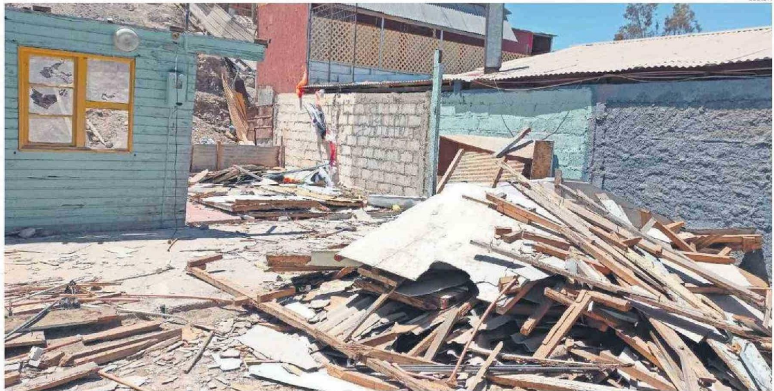
FAMILIAS DERRIBARON SUS CASAS POR PROMESAS DE PRONTA CONSTRUCCIÓN DE VIVIENDA DEFINITIVA.

El comité de vivienda "Ilusión" está conformado por siete familias, representadas por mujeres jefas de hogar, el beneficio al que supuestamente estaban postulando se denomina DSI-Tramo 3: Subsidio habitacional para construir una vi-