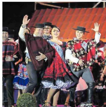
CAMPEONATO ES FINANCIADO 100% POR EL GOBIERNO REGIONAL.