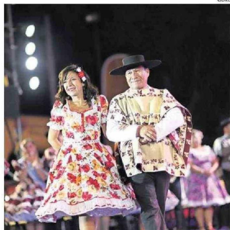
ESTE LUNES SE LLEVÓ A CABO LA SEGUNDA JORNADA.

Con días llenos de música, baile y tradición, el Campeonato Nacional de Cueca promete ser un evento inolvidable que celebra la riqueza cultural de Chile y honra el legado de quienes han dedicado su vida a preservar nuestras tradiciones más queridas. ✨