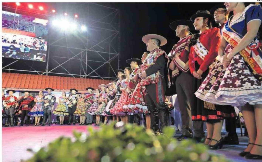
PAREJAS DE TODAS LAS REGIONES DE CHILE COMPITEN POR EL OLIVO DE ORO.

En clara alusión a la gesta histórica del Asalto y Toma del Morro de Arica del año 1880, el Gobernador Regional de Arica y Parinacota, Jorge Díaz Ibarra, expresó que "en nuestra ciudad y región se ha escrito una de las páginas más gloriosas de nuestra historia" y que agregó que, en el marco de las activida-