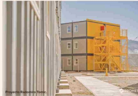
Proyecto Radomiro Tomic.

Este método constructivo otorga una serie de beneficios en comparación con la construcción tradicional. En específico, la construcción modular permite reducir la generación de residuos en más de un 80% en comparación con la construcción tradicional, así como también ahorrar más del 98% del agua por metro cuadrado construido. En esa misma línea, los módulos generan un menor impacto medioambiental al ser estructuras desmontables y reutilizables.