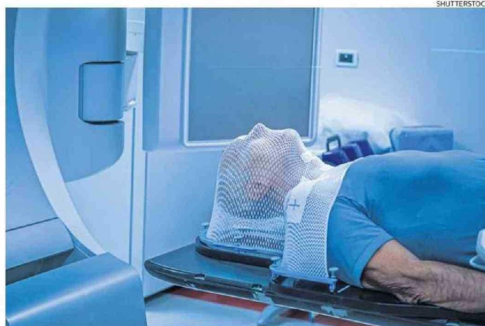
ELIMINAR LA PROTEÍNA STING AUMENTA LA TASA DE SUPERVIVENCIA.