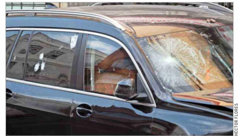
En los vidrios del automóvil quedaron las marcas de las balas.

el menor de edad fallecido era hijo de quien iban a velar esa noche. "Probablemente (...), habrá una serie de negocios ilícitos que están en juego entre una banda y otra", dijo el jefe comunal en Radio Universo.