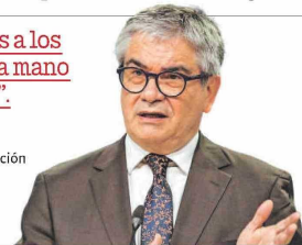
MARIO MARCEL Ministro de Hacienda habló sobre la remoción del jefe del SEA nortino que rechazó millonario proyecto de Colbún en Taital.

"A veces hay funcionarios a los que se les pasa un poco la mano en estos procedimientos".