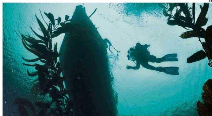
HOMBRE BUCEANDO DURANTE UNA EXPEDICIÓN EN EL CABO FROWARD, RESERVA NACIONAL KAWÉSQAR.

Clasificación de Especies Silvestres de Chile.