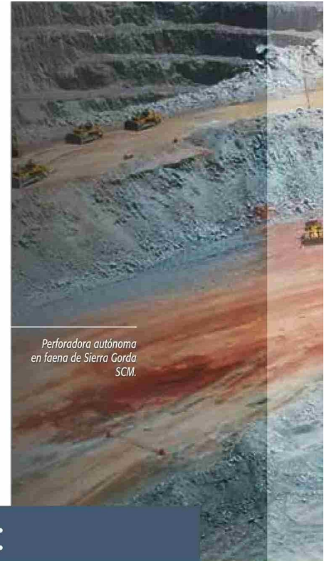
Perforadora autónoma en faena de Sierra Gorda SCM.