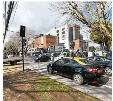
EL SEMÁFORO FUE ENCENDIDO AYER AL MEDIODÍA EN LA ESQUINA.